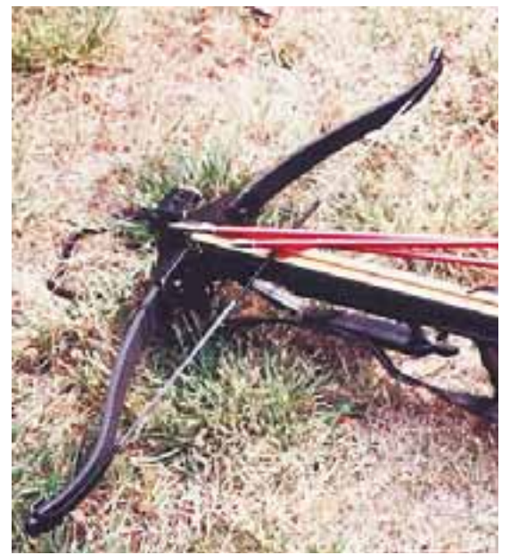
La balestra, l'arma scelta da una donna dopo una lite