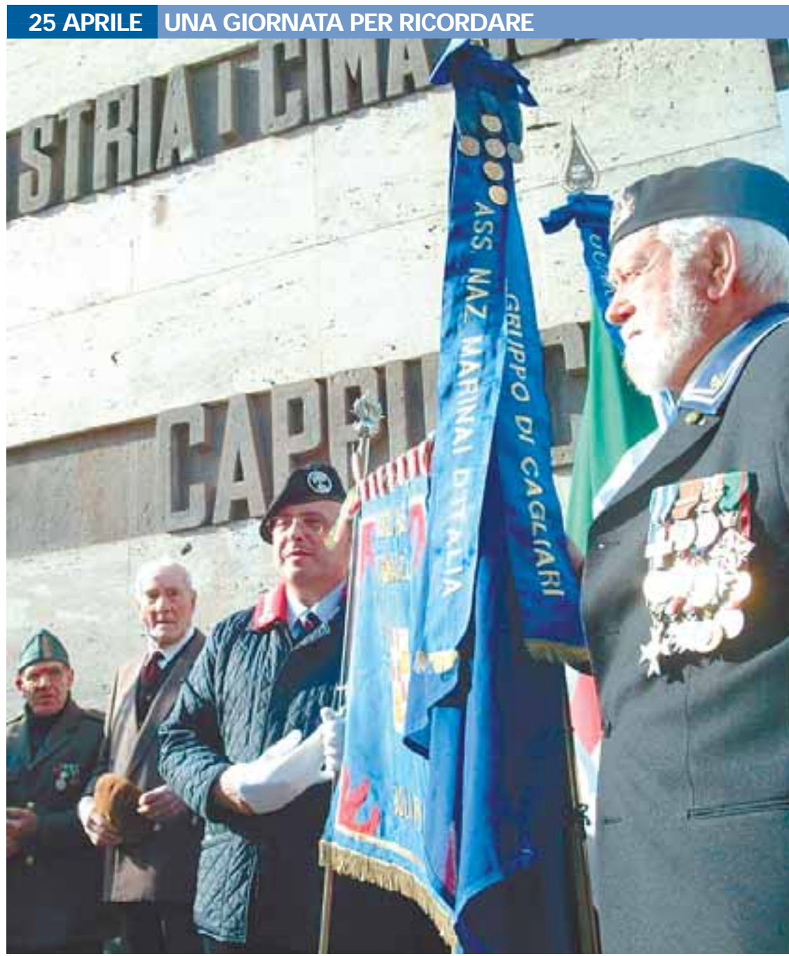
Cagliari L'Italia ha celebrato ieri il 25 aprile, festa della Liberazione. Il presidente Ciampi si è rivolto ai giovani, esortandoli ad avere fiducia nel futuro. A Cagliari la manifestazione si è svolta nel Parco delle Rimembranze (nella foto). Militari, partigiani e amministratori hanno reso omaggio ai caduti. I no global hanno sfilato contro la guerra. ▶▶ ALLE PAGINE 3, 9

Chiamate senza risposta: cresce l'angoscia dei familiari dei vigilantes rapiti Scontri a Baghdad, uccisi quattro ragazzi. Razzi contro l'ospedale di Mosul