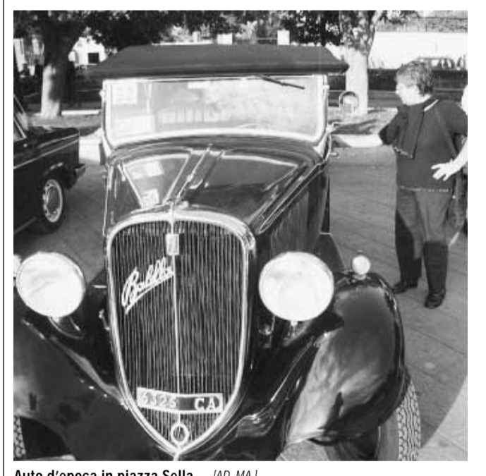
Auto d'epoca in piazza Sella.