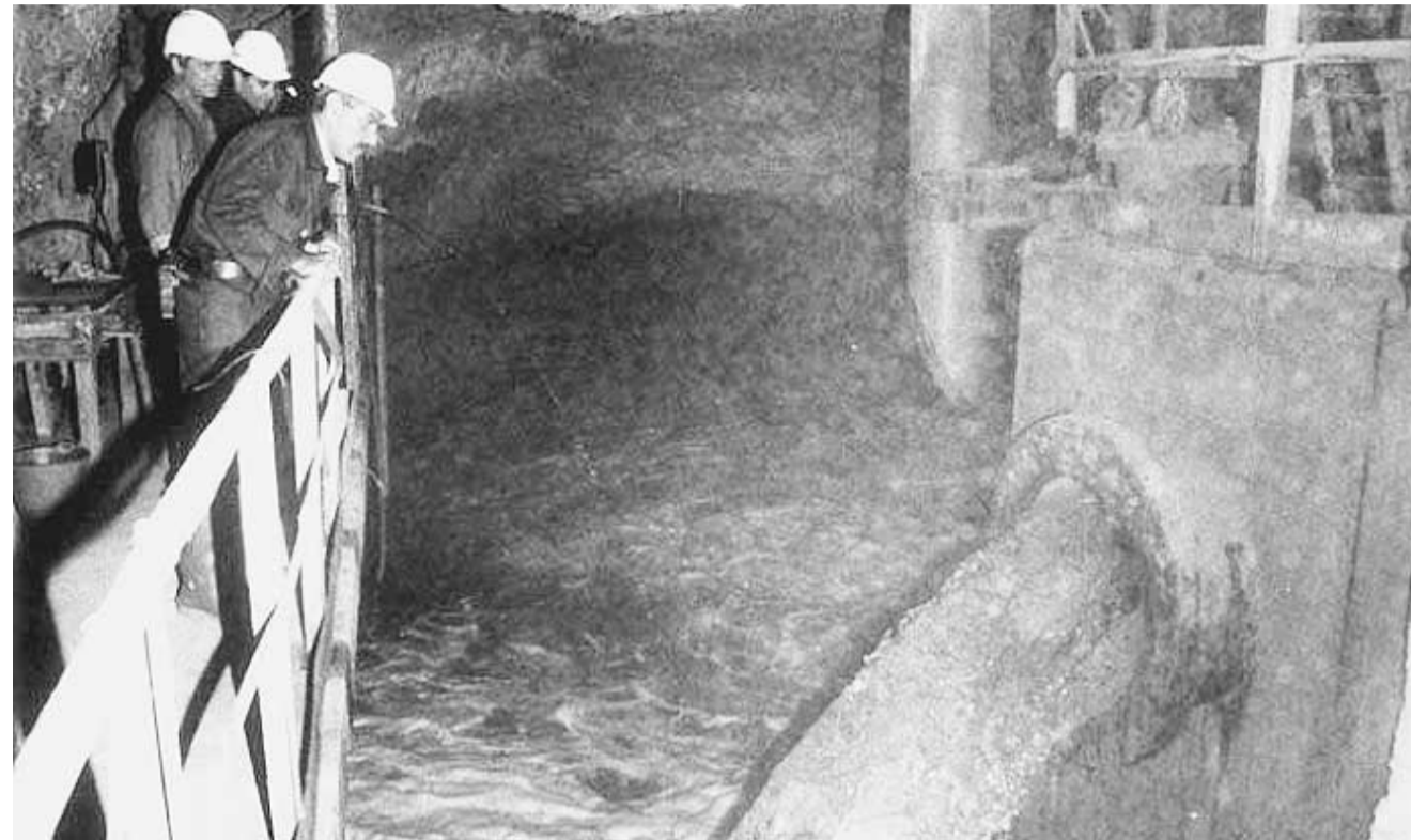
L'allagamento delle miniere.